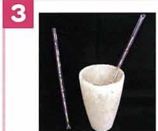
3 灰の中で約15分冷ましてできあがり!