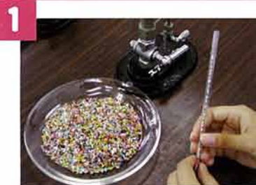
1 ガラス棒に好きなビーズを入れる。(上は3cmあけておく)