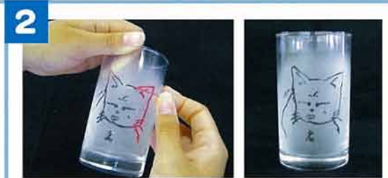
2 スタッフが発射機で砂を吹き付け後日発送。樹脂絵の具をはがすと出来上がり!