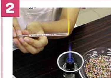
2 バーナーでガラス管の端を閉じる。