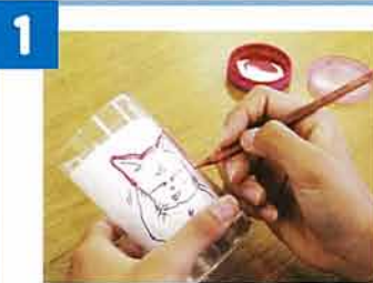
1 用意してきた下絵をコップの中に入れ上から樹脂絵の具で絵を描く。

当日の作業をスムーズに進めるため下絵の準備をお願いしています。下絵は名前ペンぐらいのマジックでコップの片面だけに入るようにしてください。(細かい絵は書きにくい)